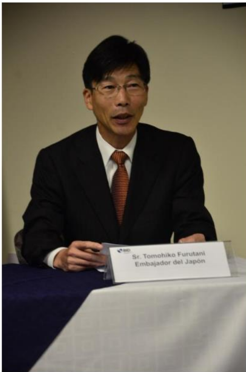
El Embajador de Japón Tomohiko Furutani explica que es importante invertir en cultura.

La contribución a este proyecto busca empoderar a las mujeres, dar a conocer sus derechos y motivar su participación ciudadana, según explicó el Embajador de Japón, Tomohiko Furutani.