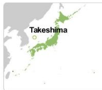
Mapa de localización