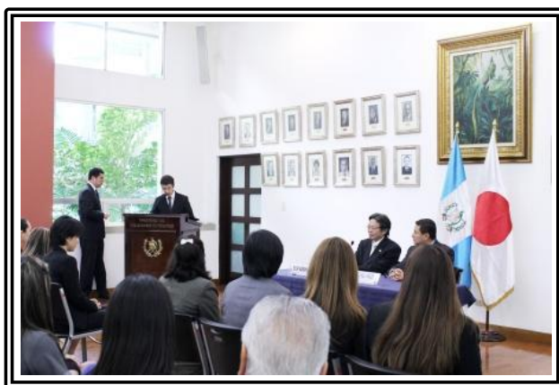
Representantes de las instituciones involucrados asistieron.

Los productos elegibles para esta donación son fabricados por pequeñas y medianas empresas japonesas que son conocidos por sus tecnologías excepcionales, eficiencia y facilidad de uso.