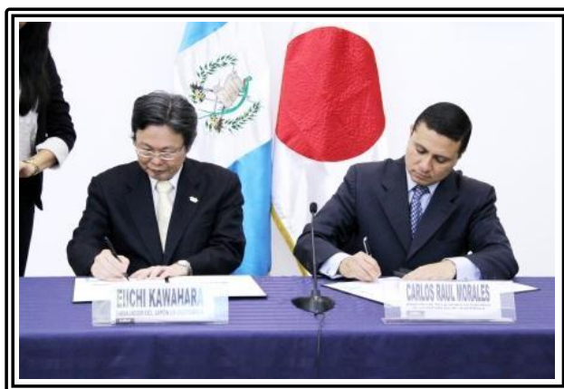
Firma de Canje de Notas