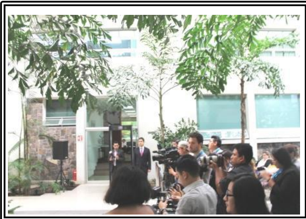
Medios de comunicación