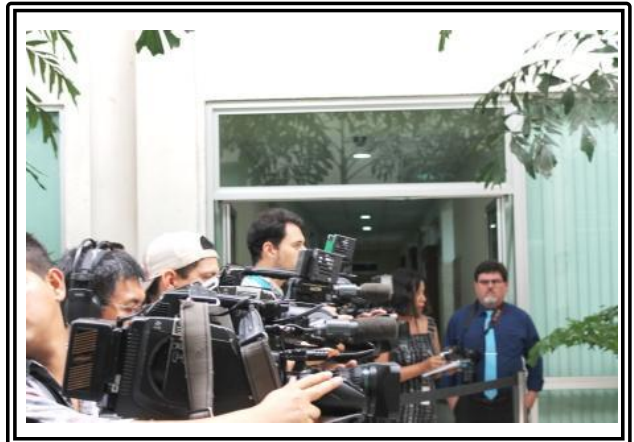
Medios de Comunicación